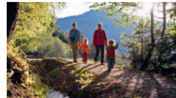
Grand bisse de Vex

98 kilomètres de balades sur Kilometer Spazierwege entlang den kilometres of walks along the 8 bisses, dont Suonen, wovon bisses, 6 en eau noch Wasser führen of which are still filled with water