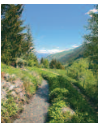
Bisse du Milieu