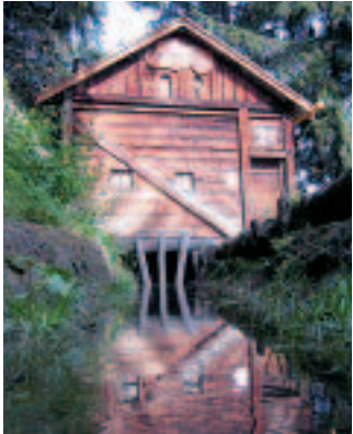
Bisse de Saxon – Cabane du Bourlâ